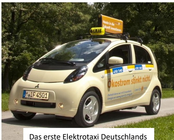
Das erste Elektrotaxi Deutschlands

Aktuell ist der Ladeservice, der übrigens auch mehrere Tage im Voraus gebucht werden kann, auf Einsatzzeiten von Montag bis Freitag zwischen 8 und 19 Uhr ausgelegt. Die E-GAP Lade-Vans kommt innerhalb von drei Stunden beziehungsweise nach Vereinbarung oder auch zu fest reservierten Zeiten. Damit bietet E-GAP ganz nebenbei – als bislang einziger Anbieter in München – fest reservierbare Ladezeiten an, und das an (fast) jedem Ort.